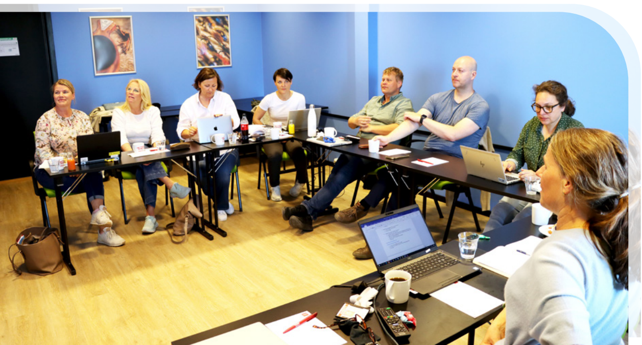
InterRegSim-møte etter MedSimNorge sin konferanse i Alta.

Alle RegSim har vært vertskap for fysiske InterRegSim møter i 2022.