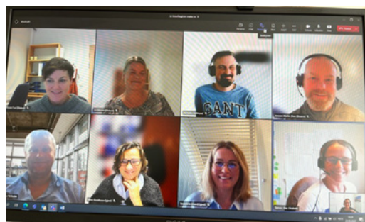
Teams møte, september 2022