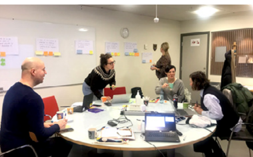
Fysisk kick off møte i Stavanger, januar 2022