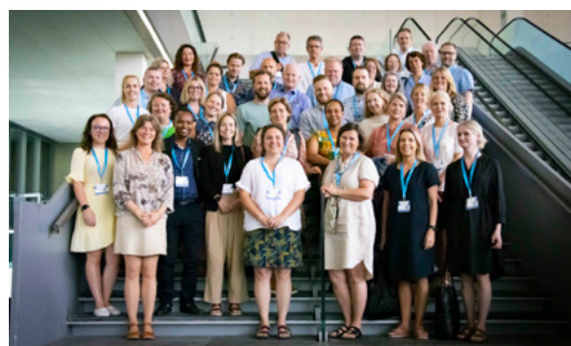
SESAM konferansen i Sevilla juni 2022 - InterRegSim sammen med andre norske deltakere.