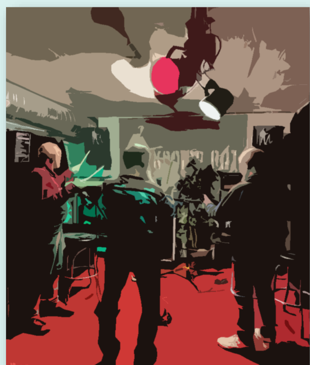
Jeg synes det er supert, veldig kjekt, både kor og band.

Musikken har en stor plass i vår hverdag, i små og større mengder. Vi lytter til musikk, har musikkquiz, spiller på ulike instrumenter, ser og hører ulike konserter.