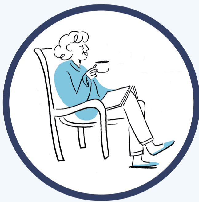
65 ÅR ELLER ELDRE