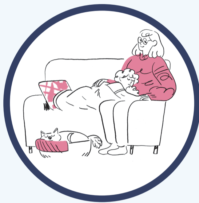
BARN & VOKSNE med enkelte kroniske sykdommer

Vaksinen reduserer sjansen for alvorlig influensa og komplikasjoner