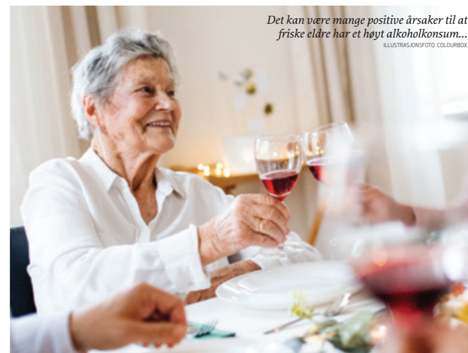
Det kan være mange positive årsaker til at friske eldre har et høyt alkoholkonsum...

Omtrent samtidig med vår forskning i Stavanger, startet et prosjekt for hjemmesykepleien og fastleger i bydel St. Hanshaugen i Oslo om eldre og alkoholvaner (Nettverk eldre og rusbruk Oslo (NERO)) (5). Bydel Gamle Oslo, Grünerløkka og Sagene var også med. I dette prosjektet brukte de begrepet Helseknaggen , som beskriver det å spørre eldre om alkoholvaner knyttet til aktuell situasjon og helseproblem (nylig restartet etter noen års dvale). Stavanger Universitets-sjukehus har i et tiår hatt en ruskonsulent-ordning i somatikken, basert på de samme