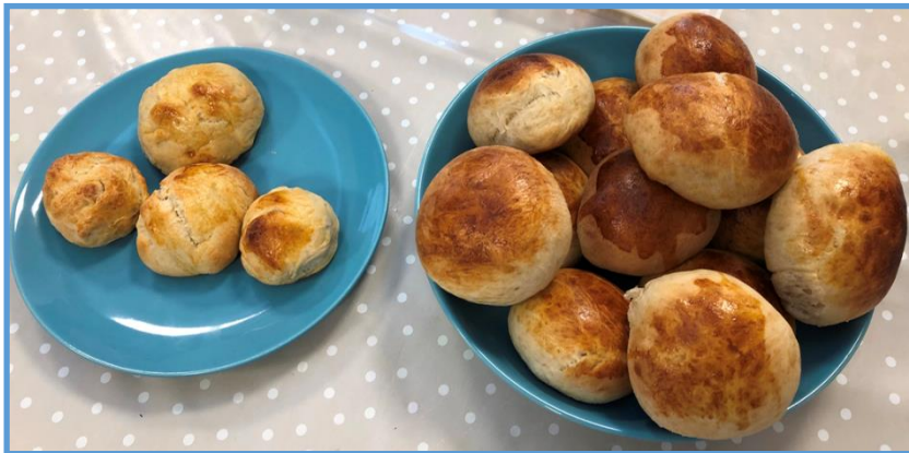
Bollebakst ved oppstart og etter 5 ukers trening