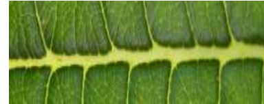
Tverrfaglige nettverk innen habilitering og rehabilitering